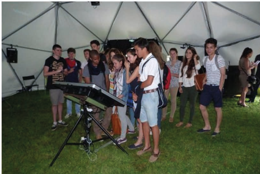
Les élèves d'une classe de seconde du Centre International de Valbonne ont été les premiers à tester Ecotype. P.C.

D'accord, ce n'est qu'un jeu. Mais l'enjeu est de taille sous le dôme Ecotype accueilli par la ville jusqu'à dimanche. Le principe consiste à endosser l'habit d'aménageur urbain, sachant que le résultat sera extrapolé au niveau national puis mondial.